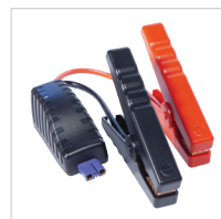
Câble de démarrage intelligent