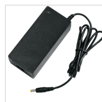
Bloc chargeur 230 V + câble secteur