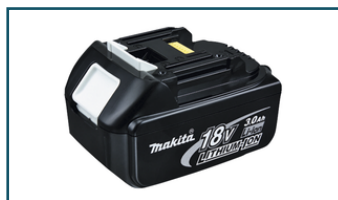
Accu BL1830 LXT 18V 3,0Ah (1 stuks)