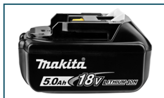
Accu BL1850B LXT 18V 5,0Ah (1 stuks)