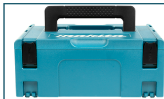
Mbox nr.2 (1 stuks)

- 837916-4 - Goingsprijs € 9,60 - 3240890397744