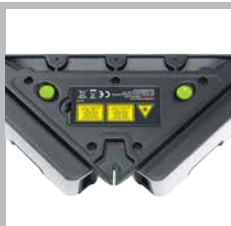
Aanleggranden en steunvlak