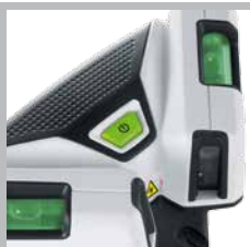
Libellen voor de afstelling van het toestel