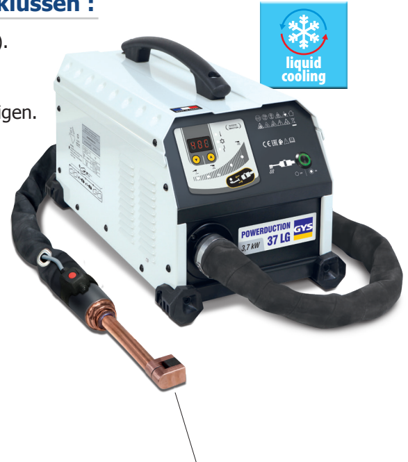
De generator wordt compleet en voorgemonteerd geleverd, met een 90° inductor.