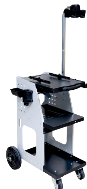
ref. 051331 + 052284 UNIVERSAL 800 + steunarm