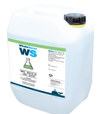
ref. 062511 Speciaal laskoelmiddel - 5 l