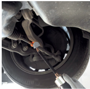
Het deblokken van trekstangen