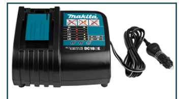
Auto oplader LXT DC18SE (1 stuks)