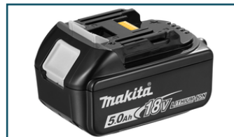
Accu BL1850 LXT 18V 5,0Ah (1 stuks)