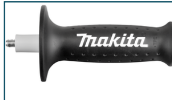
Handgreep AV M (1 stuks)

- 158237-4 - Goingsprijs € 0,00 - 0088381342452