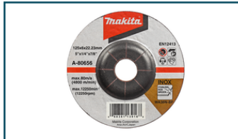
Afbraamschijf 125x6mm RVS (1 stuks)