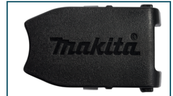
Koffer sluiting Mbox (Zwart) (1 stuks)

- 838175-3 - Goingsprijs € 9,60 - 3240890422088