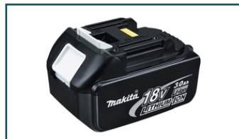
Accu BL1830 LXT 18V 3,0Ah (1 stuks)