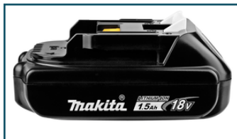
Accu BL1815N LXT 18V 1,5Ah (1 stuks)