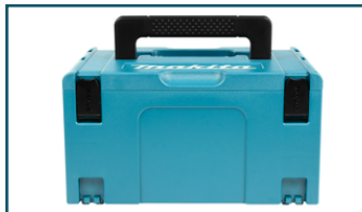
Mbox nr.3 (1 stuks)

- 821551-8 - Goingsprijs € 51,50 - 0088381432993