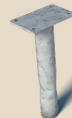
Grondanker voor inbouw onder de grond, klapzuil Plus