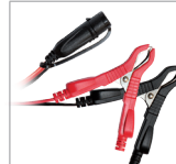
Klemmen (45 cm)