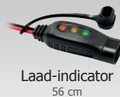
Laad-indicator 56 cm