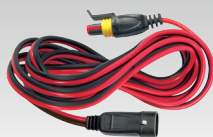
Verlengsnoer 2.5 m - 029057