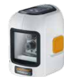
SmartCross-Laser + batterijen