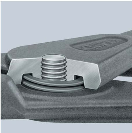
Inwendige openingsveer: de veer ligt beschermd in het scharnier en hindert niet bij het gebruik. De veer kan men niet bevuilden of verliezen.