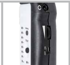
Regelbaar volume van de testsignalen