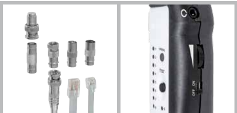
Veelzijdige adapter voor steekverbindingen