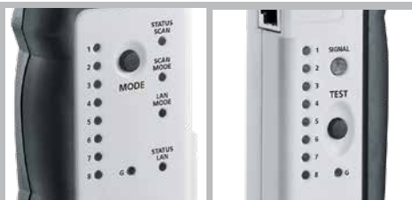
Toewijzing van de afzonderlijke geleiders bij LAN-netwerkkabels