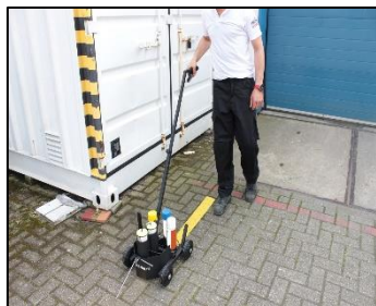
13) Geschikt voor het belijnen van randen.