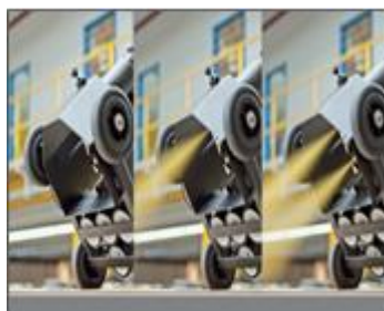
14) Gebruik met één of twee spuitbussen tegelijk mogelijk.

De in dit technisch merkblad gegeven informatie is een algemene productbeschrijving van onze ervaringen en testen en geeft geen concreet praktijkvoorbeeld weer. Hieruit kan dan ook geen aansprakelijkheid worden afgeleid. Richt u zich in voorkomende gevallen tot onze afdeling Applicatie & Techniek. Via www.veiligmetverf.nl is het veiligheidsinformatieblad op te vragen. 6-9-2022.