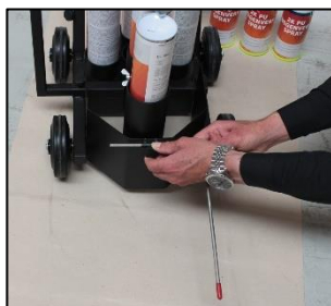
11) Richtingspijl aan de voorzijde vastmaken.