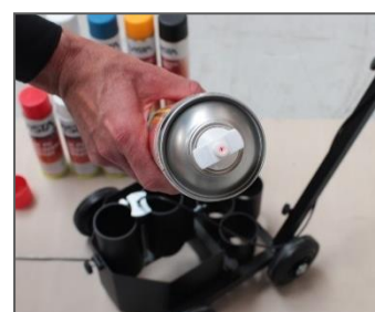
6) De spuitopening dwars op de rijrichting instellen.