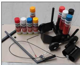
1) Overzicht van de onderdelen.