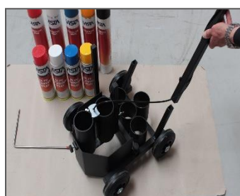
4) Handgreepstang in de kar insteken.