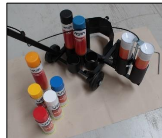
9) De spuiteenheid kan rechts of links bevestigd worden.