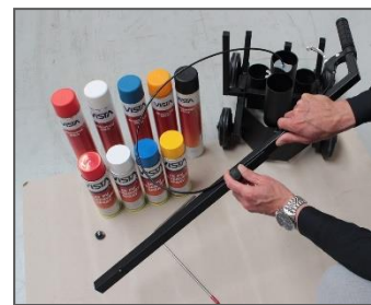
3) Handgreep monteren met schroef.