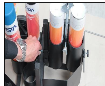
12) Schaal om spuitbreedte in te stellen.