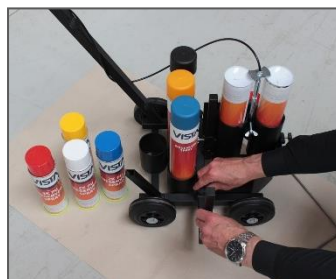
8) Het zijdelings plaatsen van de spuiteenheid.