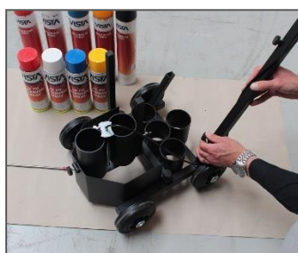
5) Handgreep met de schroef vast zetten.