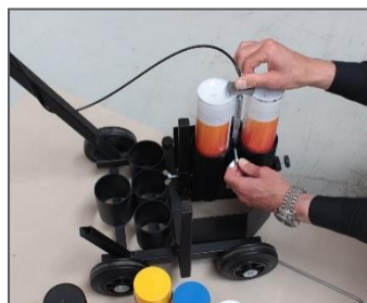
7) Spray mechanisme vastmaken.