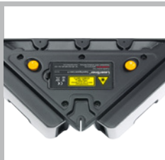
Aanleggranden en steunvlak