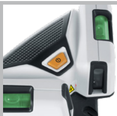
Libellen voor de afstelling van het toestel