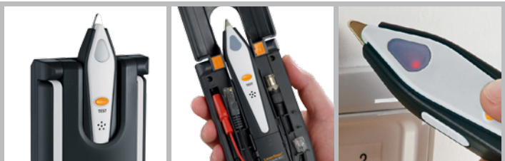
Houder voor de ontvanger