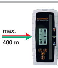
Voor rode en groene lasers