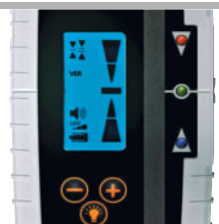
Verlicht LC-display, superfelle signalleeds