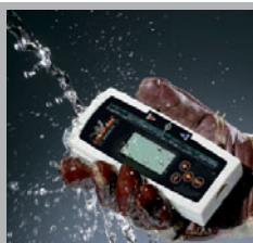
Bestand tegen stof en water conform IP 67