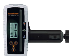
SensoLite 410 Set inclusief universele houder + batterij