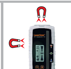
Kop- en zijmagneten