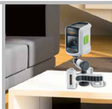
FlexClamp Plus met standvoet