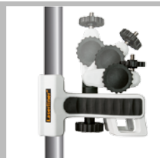
Eenvoudige en veelzijdige verstelling