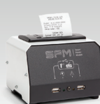
SPM : Printer module 026919