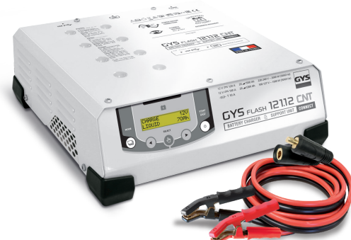
Geleverd met kabels (5 m - 25 mm 2 )